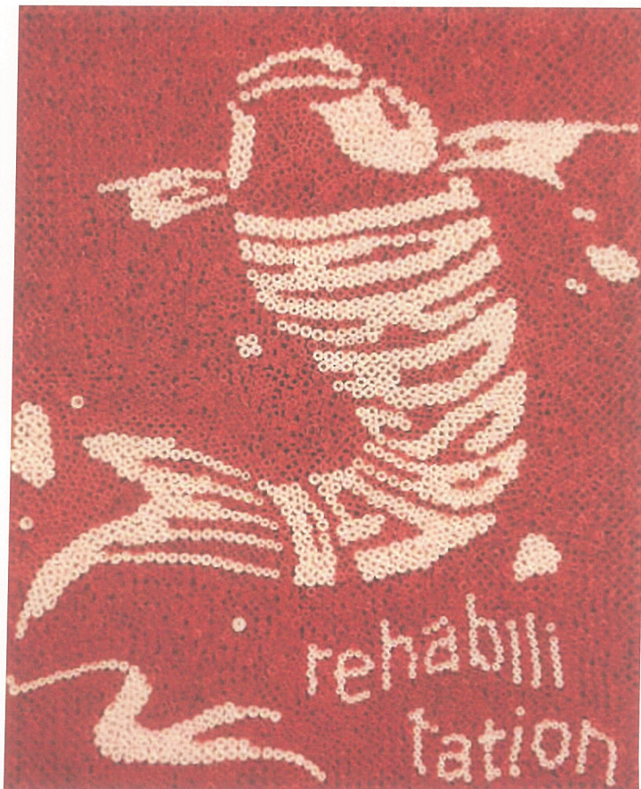
1階利用者：森岡 恵美子 様 作