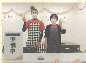
炊込み御飯・豚汁